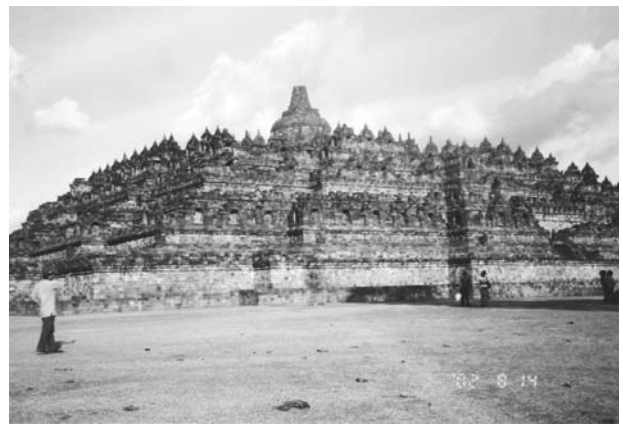
ボロブドール全景

インドネシアはイスラム教の国であるので原則飲酒は禁止されている。しかし世界の他の国々を見る